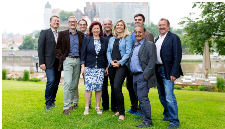
Das Strategieteam der Saxonia Systems AG